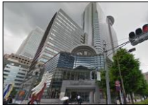
※矢印の場所から見た画像